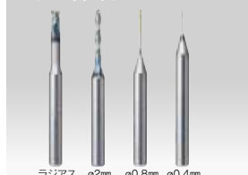
ラジラス (φ3mm) φ2mm φ0.8mm φ0.4mm